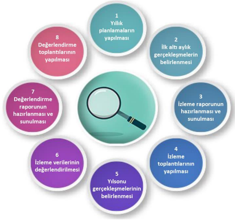
Şekil-4 İzleme ve Değerlendirme Süreci

İzleme ve değerlendirme sürecinin işleyişi ana hatları ile yukarıdaki şekilde özetlenmiştir.